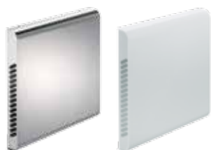
Het buitenmuurpaneel is optioneel verkrijgbaar in roestvrij staal of kunststof.