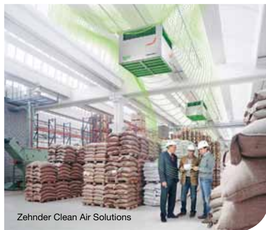
Zehnder Clean Air Solutions