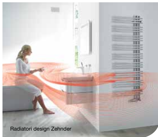
Radiatori design Zehnder