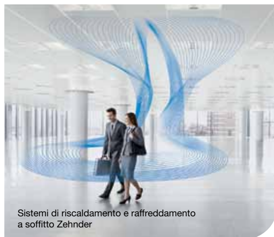
Sistemi di riscaldamento e raffreddamento a soffitto Zehnder