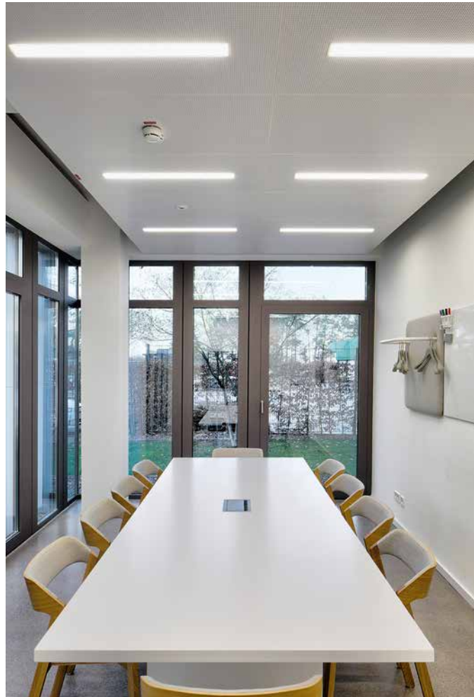
Am Hauptstandort der Firma Bette in Delbrück wurde im Jahre 2017 das Verwaltungsgebäude größtenteils kernsaniert bzw. neu gebaut. Bauliche Hauptkriterien für die neuen Räumlichkeiten waren die Steigerung des Raumklimakomforts sowie zeitgemäße energetische Kriterien.