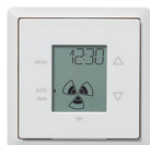
Bedieneinheit ComfoSense 67