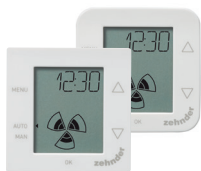
Bedieneinheit ComfoSense 55